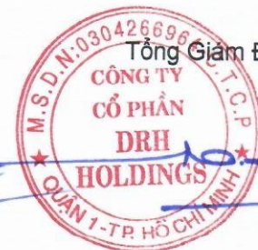
Ngô Đức Sơn